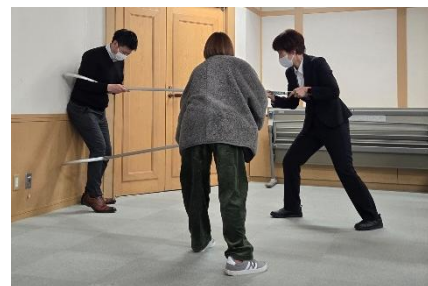
↑ さす又を実際に使用する様子

今回の交流会をきっかけに、より安全で安心できる施設環境づくりを推進していきたいと思います。