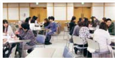
災害支援ナース交流会【参加者：30名】