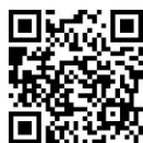
申込み用 QR コード

公益社団法人 長崎県看護協会 総務部 学会誌事務担当: 松岡 〒854-0072 諫早市永昌町 23-6 TEL 0957-49-8050 / FAX 0957-49-8056 E-Mail: gakkai@nagasaki-nurse.or.jp