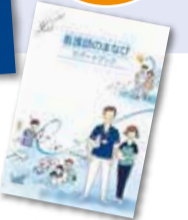
表1 看護実践能力 [看護師のまなびサポートブック]より抜粋(P27~28掲載)