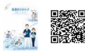
【看護実践能力】 「看護師のまなびサポートブック」掲載