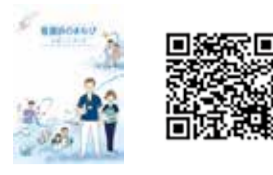
【看護実践能力】 【看護師のまなびサポートブック】掲載